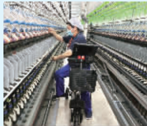
大生集团10万锭智慧纺纱工厂