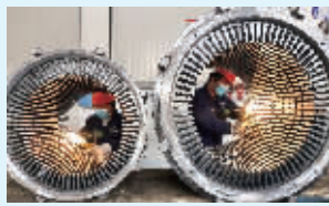
工人在南通通达砂钢冲压科技有限公司的生产车间忙碌