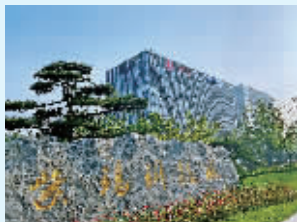
南通创新区紫琅科技城