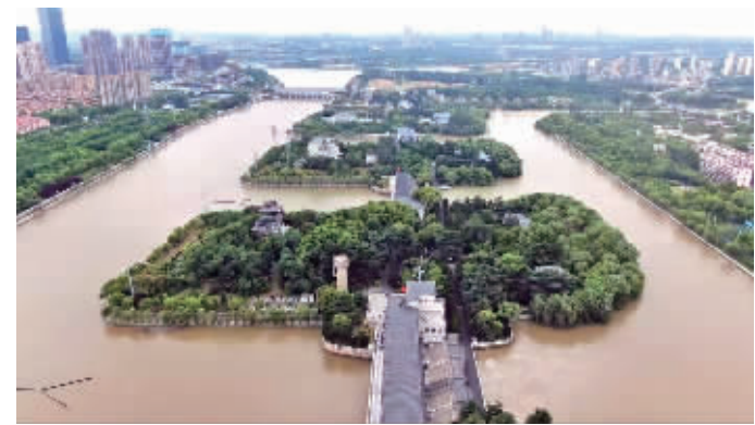
江都水利枢纽已累计抽江北送409亿立方米

江都水利枢纽是南水北调东线工程的源头,也是目前我国规模最大的电力排灌工程、亚洲最大的泵站枢纽。5月18日,“高质量发展调研行”主题采访活动来到扬州江都水利枢纽,了解这个水利“超级工程”如何将一江清水送往北方的。