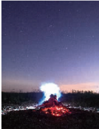
那些年一起看过的星空