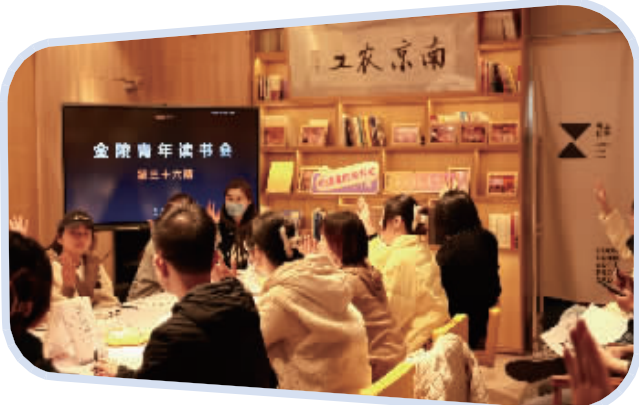
读书会现场 受访者供图