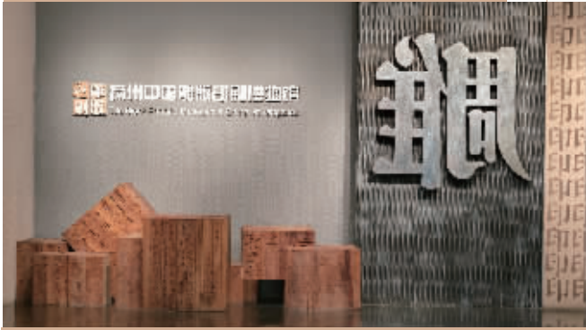
扬州中国雕版印刷博物馆