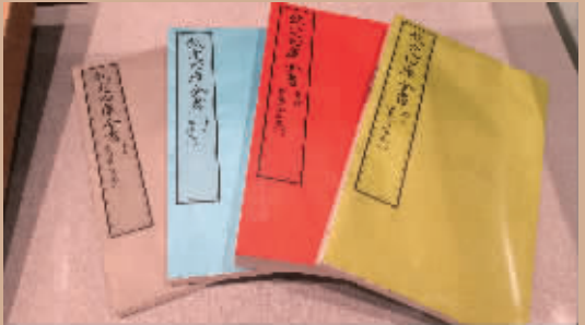
扬州文汇阁中的《四库全书》