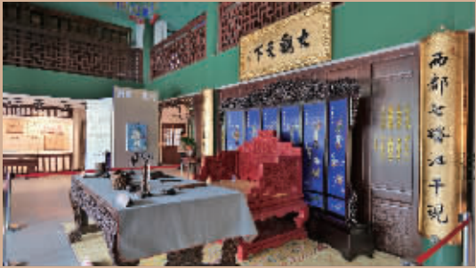
扬州文汇阁一楼有“大观天下”匾额