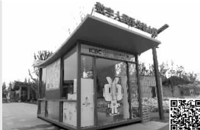
位于金陵STYLE浪漫中心的南京首座数字人民币体验小屋 扫码看视频

近日,常熟市地方金融监督管理局和常熟市财政局印发《关于实行工资全额数字人民币发放的通知》,根据《通知》,5月起,公务员实行工资全额数字人民币发放。5月初,江苏省教育厅印发《江苏省教育领域数字人民币试点实施方案》,提出全面推进教育领域数字人民币试点工作。今年以来,关于数字人民币的消息频传,不仅各省积极发布相关政策,各设区市也积极响应,落地应用场景。数字人民币究竟是什么?它和现金是一回事吗?数字人民币支付和当前的第三方支付平台有何区别?现代快报记者就此展开调查。