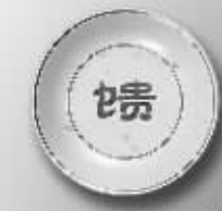
大地情怀 拒绝浪费