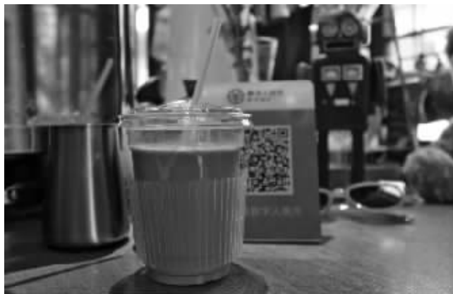
记者使用数字人民币购买的咖啡