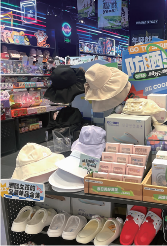
各类物理防晒产品