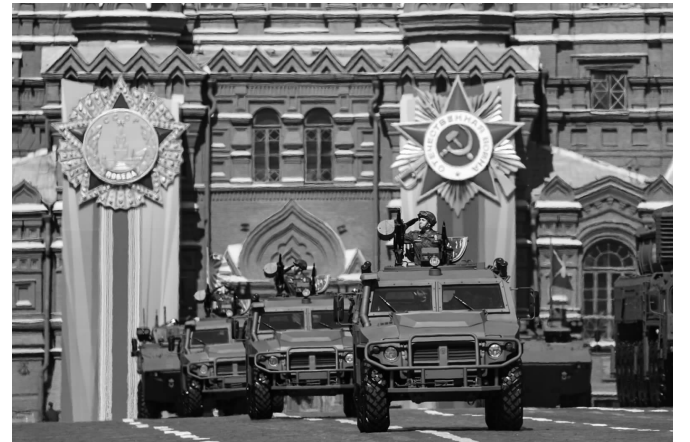
5月9日在俄罗斯首都莫斯科,军车编队驶过红场

为纪念卫国战争胜利78周年,俄罗斯9日在莫斯科红场举行阅兵式。俄国防部长绍伊古和俄联邦武装力量陆军总司令奥列格·萨柳科夫乘车检阅各方队。俄总统普京出席并致辞。