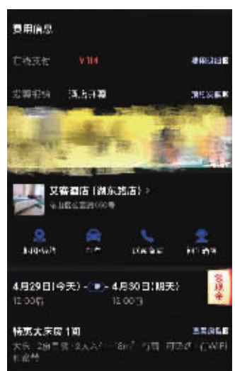
小徐在马鞍山的酒店住了一晚,花费114元

第一天的住宿解决了,第二天怎么办?南京一男性朋友建议小徐可以去网咖。“如果不是有这个朋友陪着,我们不敢去网咖。网咖比网吧的条件好很多,50元左右可以包夜,就是非常吵。”小徐说自己没想到网咖人也爆满,都是和自己差不多的学生,由于一直有人在