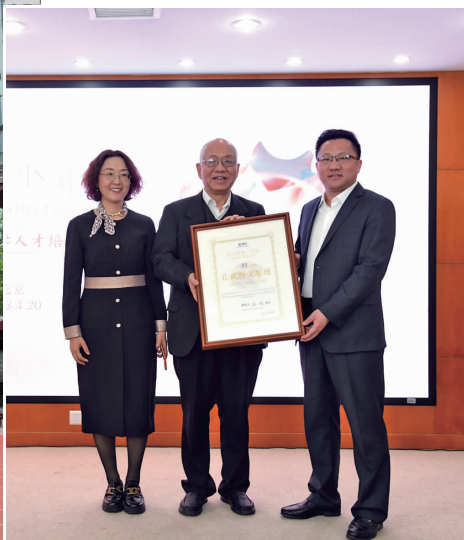
丘成桐教授为南京一中授牌