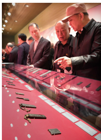
4月27日，参观者在曹操高陵遗址博物馆内观看展品