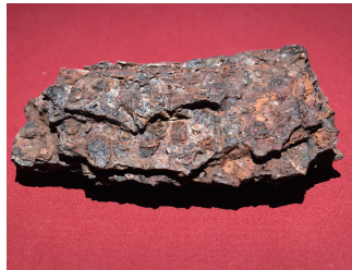
这是曹操高陵遗址博物馆内展出的铁甲片