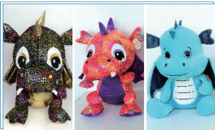
扬州牧美各种风格的恐龙宝贝