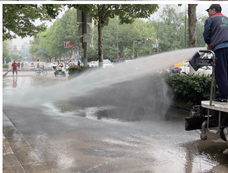
21日上午8点20分左右,抢修完成,环卫工人冲洗淤泥