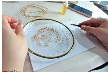
用铜丝勾勒出基本图案