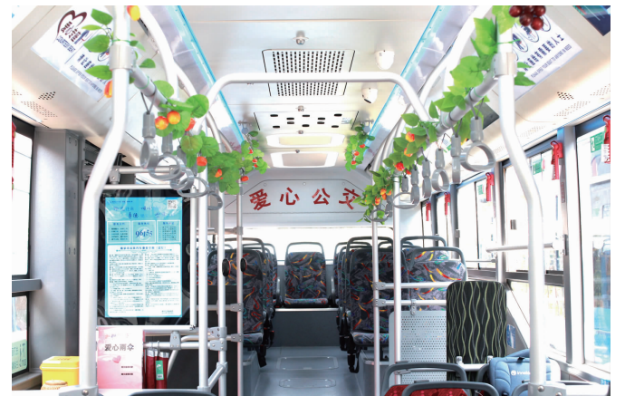
501路爱心公交

快报讯(通讯员 陈晓辉 记者 李娜)公交车上也有了儿童座椅。4月19日,现代快报记者了解到,在南京一辆501路公交车上,车队联合驾驶员率先配上了儿童专属座椅,不仅让儿童乘坐更加安全,也解放了家长的双手。此外,车上还配有应对突发疾病的急救药箱、便民雨伞、一次性塑料袋。这辆爱心满满的公交车,让乘客纷纷点赞。