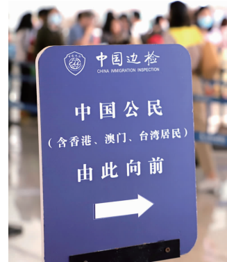
出入境检查现场

快报讯(通讯员 宁边新 记者 季雨)4月18日下午,南京飞台北的MU5001次航班从南京禄口国际机场起飞,这标志着停飞近38个月的“南京-台北”航线重新启航。