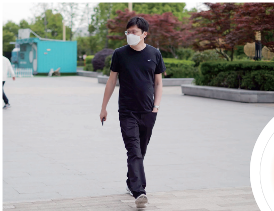
雾霾散尽,气温回升,南京街头很多行人已是夏天装扮