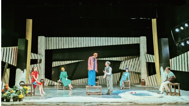
话剧《我这半辈子》剧照