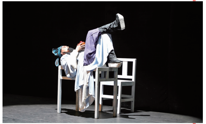
昆剧《伯龙夜品》剧照