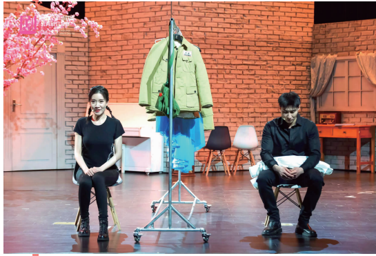
话剧《似是故人来》剧照