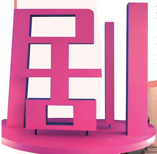
大华大戏院·群剧场