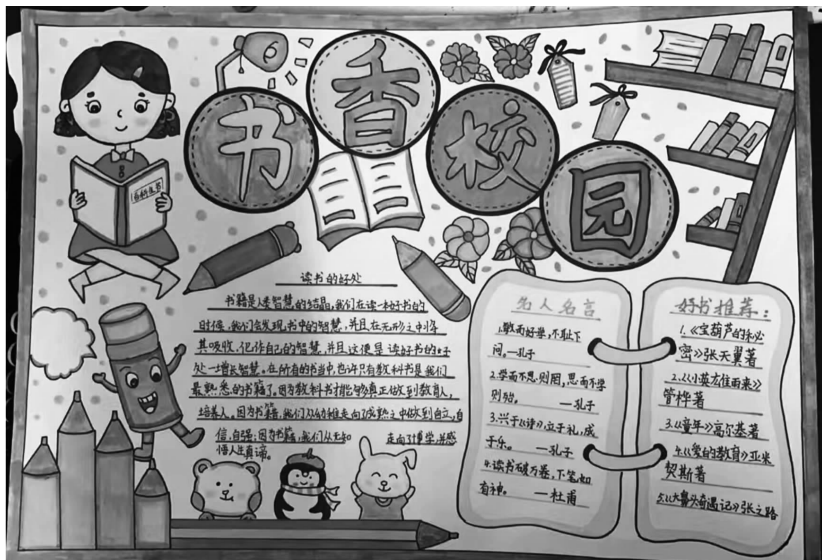
沛县泗水小学六(10)班 宋博雅 指导老师:邢文文