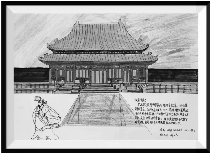
沛县泗水小学六(10)班 徐飞 指导老师:邢文文