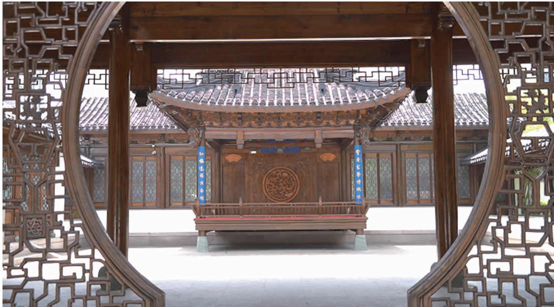
曹府戏苑