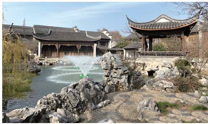
如今的网红打卡点“芥子园”

可惜,1672年,李渔携家班自金陵溯江而上,遨游楚汉之间,乔姬竟因过度劳累客死他乡。第二年,王姬也得病死去。李渔家班也因这两位的去世星散夭折。