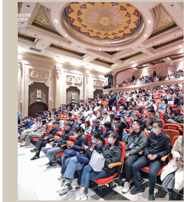
观众在国民小剧场看演出