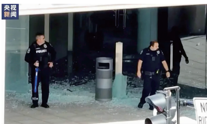
案发现场

美国阿拉巴马大学发言人沙勒·多里尔证实,斯特金于2020年12月从该校毕业,因加入“加速硕士课程”,其在毕业时同时获得了经济学的学士和硕士学位。此外,斯特金在职业社交网站领英上的个人资料显示,2018年至2020年,他连续三个暑假都在事发银行实习,并于2021年6月以正式员工的