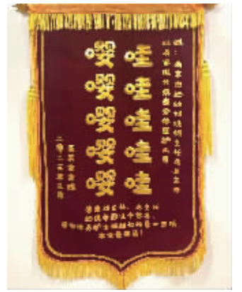
特别的锦旗

许多患者在康复出院之后，会送医护人员一面锦旗来表示感谢，通常写上“医术精湛 医德高尚”之类的赞美之词。近日，南京市妇幼保健院产科家庭化病房收到一面自带“语音”的有趣锦旗，锦旗上写着“哇哇哇哇哇，嘤嘤嘤嘤嘤”，似乎是一个宝宝正向大家表示感谢。