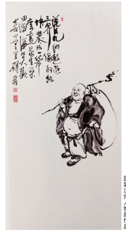
圆霖法师人物画作品