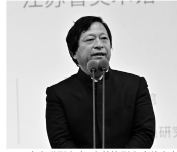
省文联副主席、省美协副主席徐惠泉