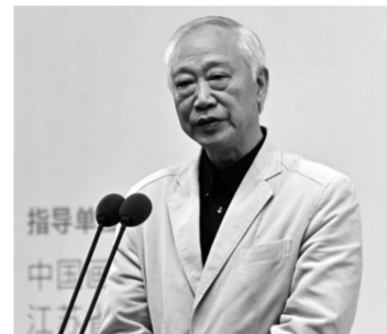
中国画学会副会长兼秘书长,中央美术学院教授、博士生导师罗世平