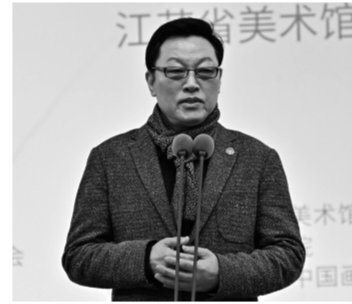
中国画学会创会副会长、省中国画学会会长高云