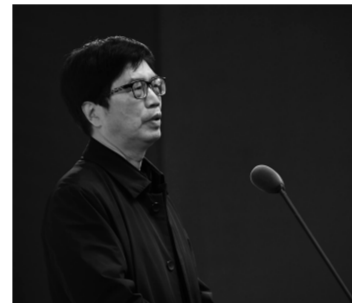
省文联主席章建华