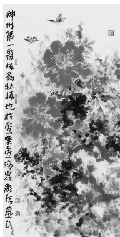
韩显红《神州第一香》138cm×70cm