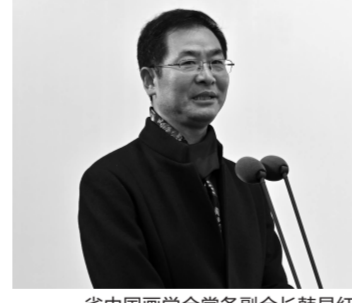
省中国画学会常务副会长韩显红