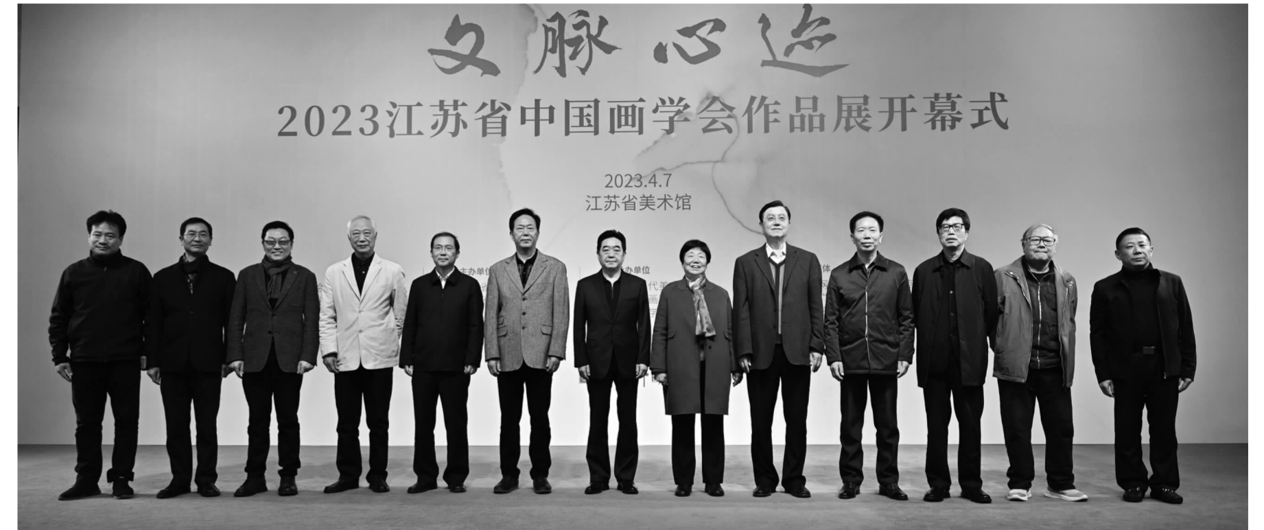
与会领导嘉宾在开幕式现场合影

4月7日,由中国画学会、江苏省文化和旅游厅、江苏省文学艺术界联合会指导,江苏省美术馆、江苏省中国画学会主办,源·当代美术馆、十竹斋画院和东南大学中国画研究院承办的“文脉心迹·2023江苏省中国画学会作品展”在江苏省美术馆开幕。省政协原主席张连珍,省委常委、省委宣传部部长张爱军,省政协原副主席、江苏国际文化交流中心理事长罗一民,南京市人大常委会原主任陈绍泽,原南京军区联勤部政委汪晓荣,江苏省中国画学会理事长王强共同为2023江苏省中国画学会作品展揭幕。活动现场,中国画学会副会长兼秘书长,中央美术学院教授、博士生导师罗世平向江苏省中国画学会捐赠了一套书集,江苏省中国画学会副会长兼秘书长翟优代表学会接受捐赠。本次开幕式由省中国画学会常务副会长韩显红主持。