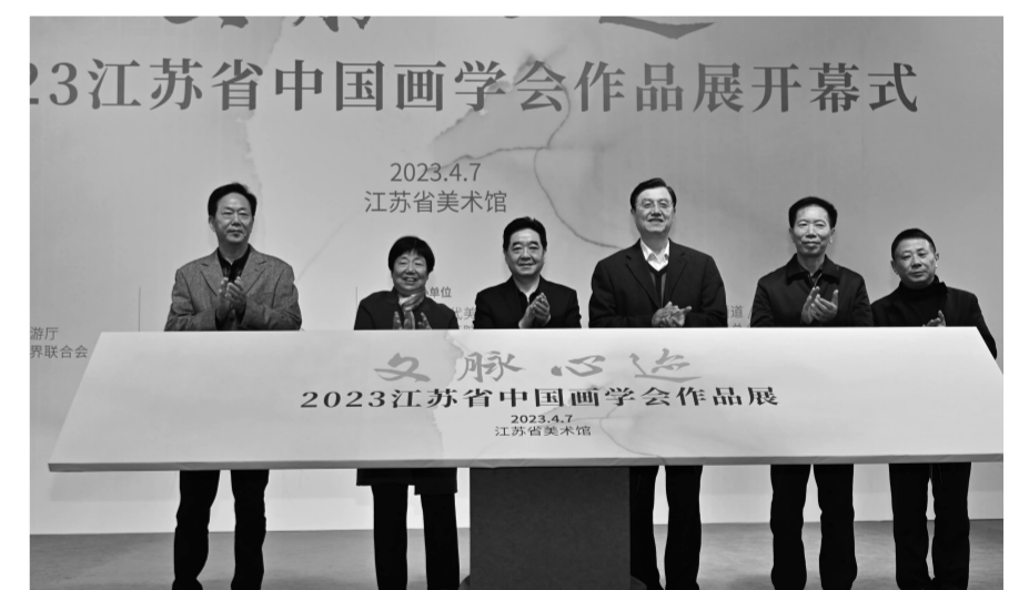
与会领导为本次展览揭幕