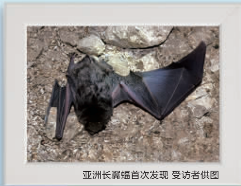
亚洲长翼蝠首次发现