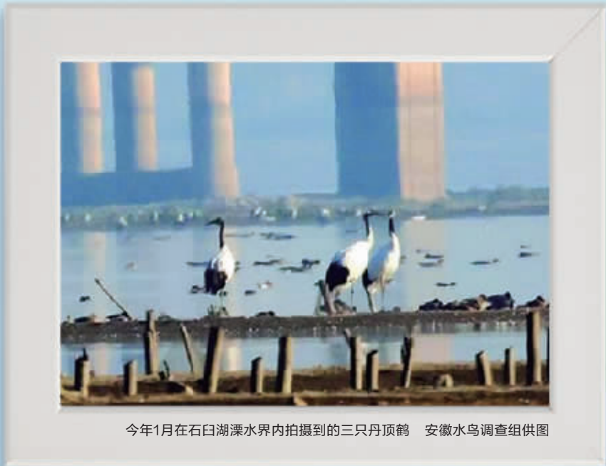
今年1月在石臼湖溧水界内拍摄到的三只丹顶鹤