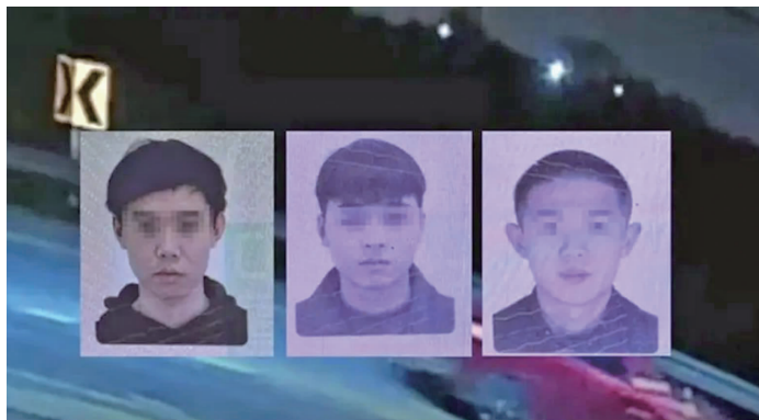
泰国媒体公布的3名嫌疑人照片