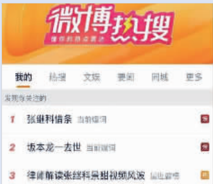
4月2日晚,“张继科借条”冲上微博热搜首位网络截图

张继科姓名曾被多家公司进行商标抢注。企查查App显示,“张继科”商标曾在2012年、2016年分别被江苏永名体育器材有限公司、北京聚赛文化发展有限公司申请注册,国际分类均为健身器材。不过,两枚商标均被驳回。另外,申请“张继科”商标的两家公司已注销。