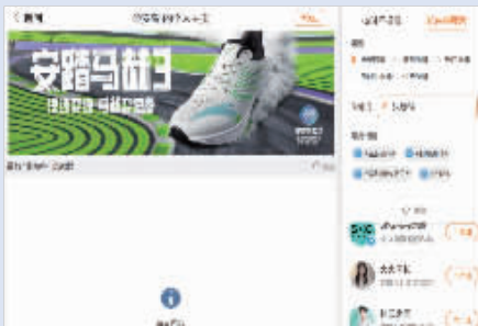
在安踏官微中搜索“张继科”,已显示“暂无内容”网络截图