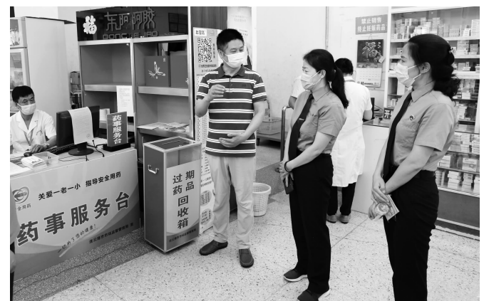
检察官深入药店进行了解