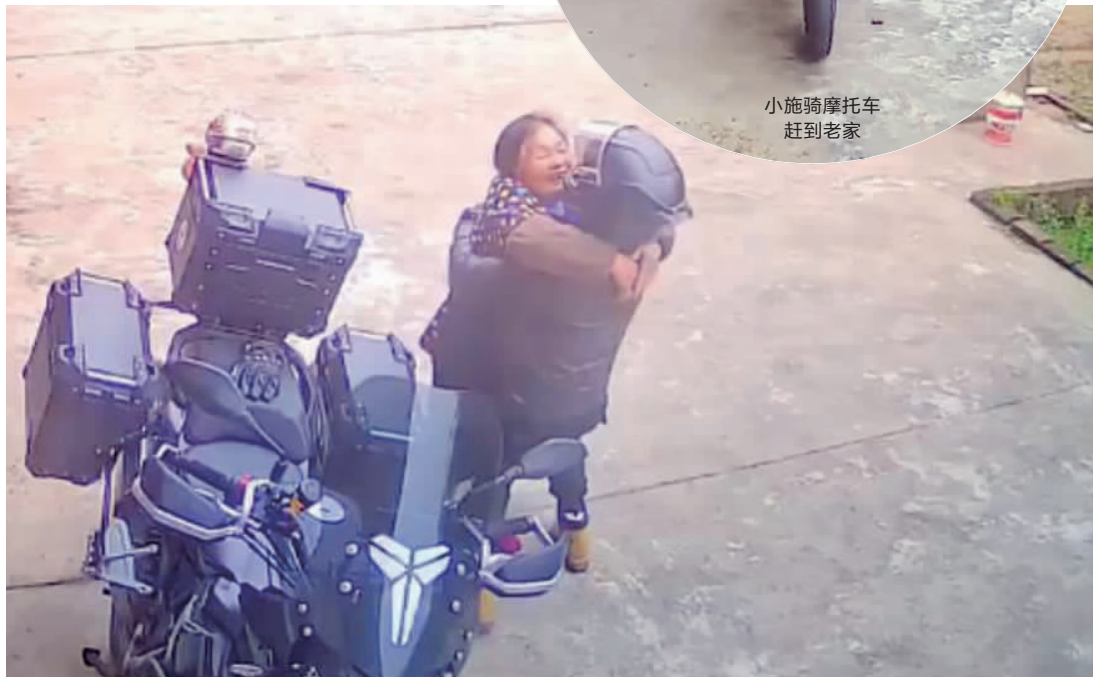
小施给奶奶一个温暖的拥抱 视频截图

当天晚上,奶奶拿出平时舍不得吃的食材,给小施张罗了一大桌子好吃的。“其实很多老人都是这样,自己