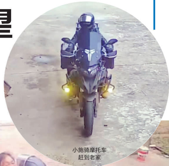
小施骑摩托车 赶到老家