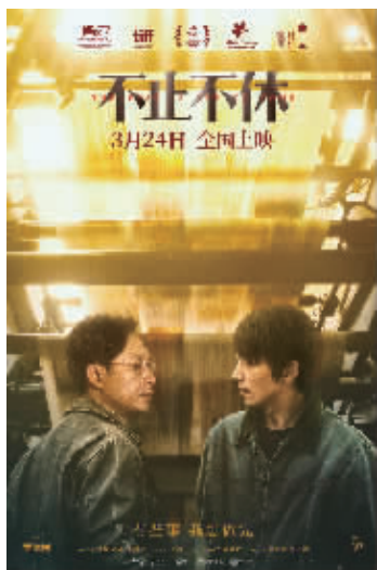
电影《不止不休》海报