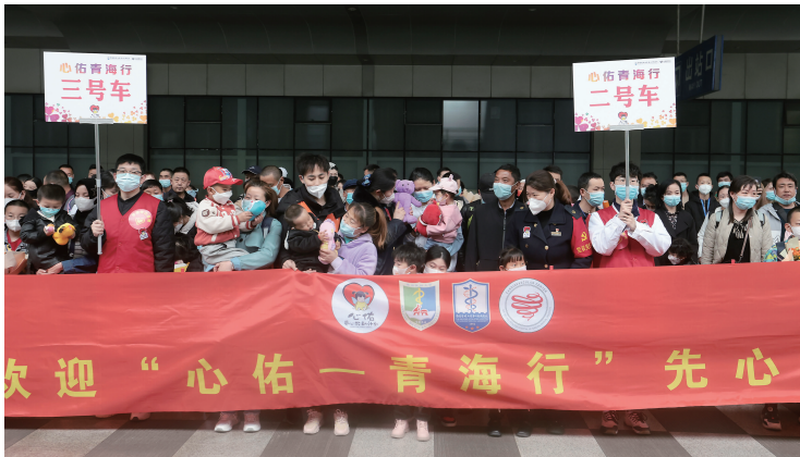
首批44名患儿及陪同家属抵达南京站

苏青一家亲,心佑江海情!近日,南京医科大学第二附属医院(以下简称“南医大二附院”)启动第8次心佑工程·青海行,将免费救治青海52名先心病儿童及青少年。3月25日中午,44名孩子乘坐火车抵达江苏南京,他们将在南医大二附院通过手术重获“心”生。现代快报记者了解到,一次性救助超过50名先天性心脏病患儿,在苏青帮扶史上实属少见。