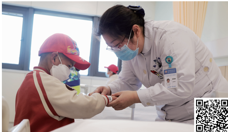
护士在给患儿戴手环(扫码看视频)