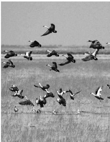
在江苏越冬的水鸟多达82种

快报讯(通讯员 鹿祖权 记者 卢河燕)2023年1月,江苏省林业局组织南京大学、南京师范大学、南京林业大学、江苏省林科院、江苏大丰麋鹿国家级自然保护区、江苏盐城湿地珍禽国家级自然保护区等多家单位联合开展了江苏省2023年越冬水鸟同步调查。这是首次全省范围的大规模越冬水鸟同步调查,共记录水鸟82种42.0855万只。其中,丹顶鹤、东方白鹳、黑脸琵鹭等国家一级重点保护动物11种2304只。