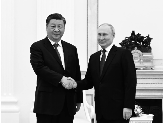
当地时间3月20日下午,刚刚抵达莫斯科的国家主席习近平应约在克里姆林宫会见俄罗斯总统普京

国国家主席再次表示热烈祝贺。普京表示,过去十年来,中国各方面发展都取得令世人瞩目的伟大成就,这归功于习近平主席的卓越领导,也证明了中国国家制度和治理体系的优越。我坚信,在习近平主席坚强领导下,中国必将继续发展繁荣,顺利实现各项既定宏伟目标。在双方共同努力下,近年来俄中关系在各领域都取得了丰硕成果。俄方愿同中方继续深化双边务实合作,加强在国际事务中的沟通协作,推动世界多极化和国际关系民主化进程。