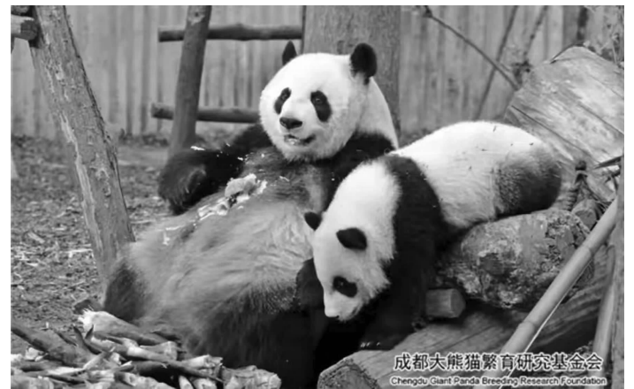
大熊猫“宝新”(右)和妈妈“宝兰”

近日,有网友反映成都大熊猫繁育研究基地的熊猫“宝新”自3月初再也没有出现过,疑已去世。3月21日,成都市公园城市建设管理局一位工作人员称,“宝新”确已去世,但死因还不明。