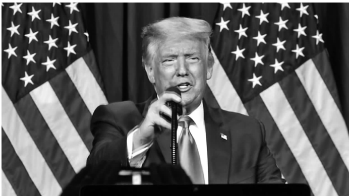
美国总统特朗普