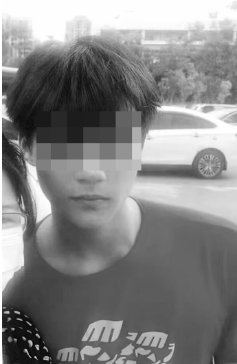
小邓近期的生活照

目前小邓他们是否安全?邓小姐说,21日中午,弟弟跟朋友微信联系了,说自己“平安”“先去吃饭