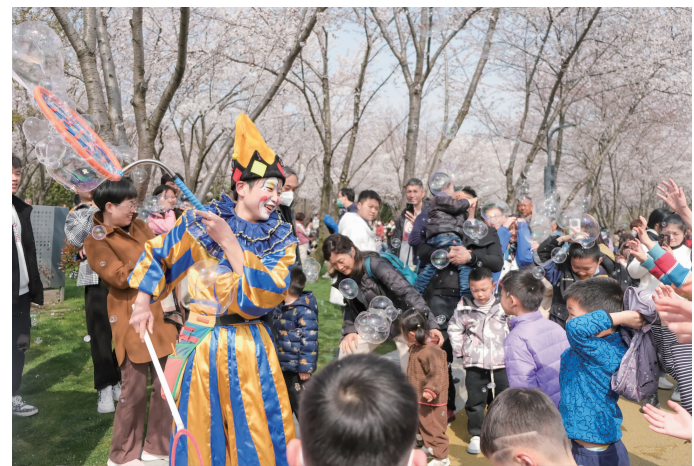
“樱”嬉泡泡秀吸引小朋友围观

3月18日下午,2023无锡经济开发区“经”心旅游节暨“樱”你而美”文旅促消费系列活动在金匮公园正式启幕。经开樱花特色旅游线路正式发布;周新里文化街区美好空间、金匮公园文体公园美好空间集中揭牌;乐游无锡·遇见美好无锡经开区惠民措施、特色文体活动正式发布。