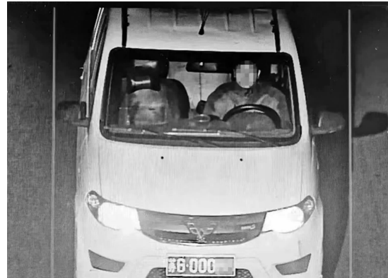
嫌疑人作案时驾驶的机动车牌号很特别

快报讯(通讯员 柏战 记者 王晓宇)近日,连云港市赣榆区金山镇多个村民家里遭遇入室盗窃。案发后,民警在调查中得知,案发前,受害人家门前曾出现过一辆带“豹子号”车牌的面包车,民警随即根据村民记下的车牌号展开调查,成功锁定嫌疑人,并将其抓获归案。