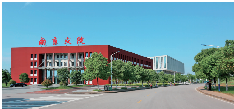
美丽校园