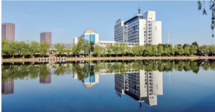
江苏海事职业技术学院优美的校园