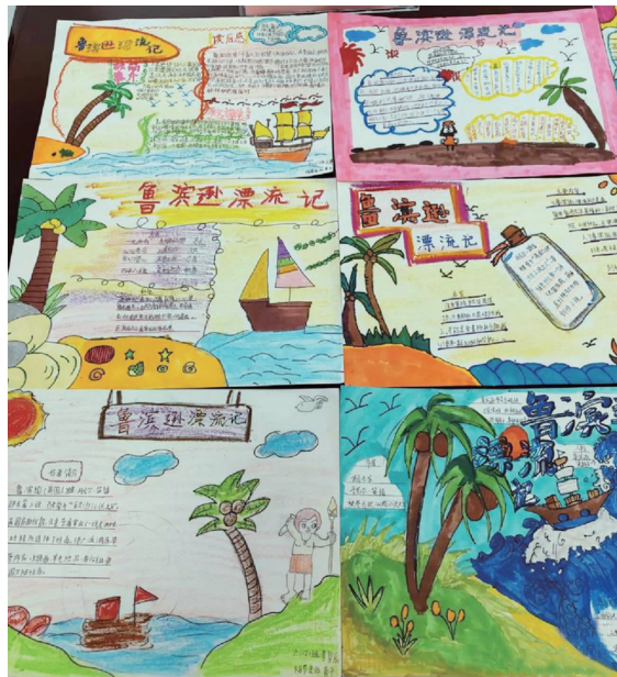
孩子们制作的手抄报