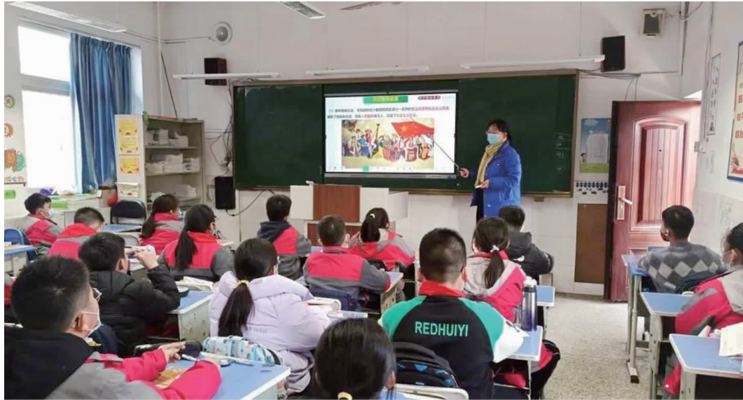
民族团结教育主题班会

为丰富校园文化生活,培养学生民族团结意识,增强民族自豪感,大屯矿区第一小学举行“民族团结一家亲 同心共筑中国梦”主题系列活动。 首先是“民族团结一家亲 同心共筑中国梦”国旗下讲话。活动中,学校少先队代表在国旗下号召全体学生,继续保持积极向上的精神风貌,继承优良传统,开创各族师生团结友爱、和睦相处、互帮互助、共同发展的新局面,全力构建和谐