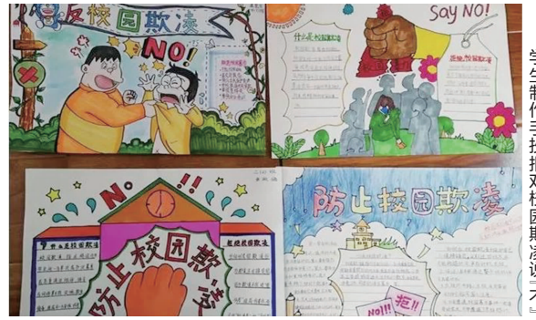
学生制作手抄报对校园欺凌说“不”

的民族团结感人的事迹等,随后开展了积极热烈的发言和讨论。通过本次班会,让学生们了解和学习了各民族的灿烂文化同时,也更加坚定了孩子们努力学习、为维护民族团结和祖国统一贡献自己力量的决心! 学校也将在以后的工作中不断总结经验,认真开展民族团结进步教育活动,让五十六个民族的灿烂文化在孩子们的心灵中播下“中华民族一家亲”的种子。