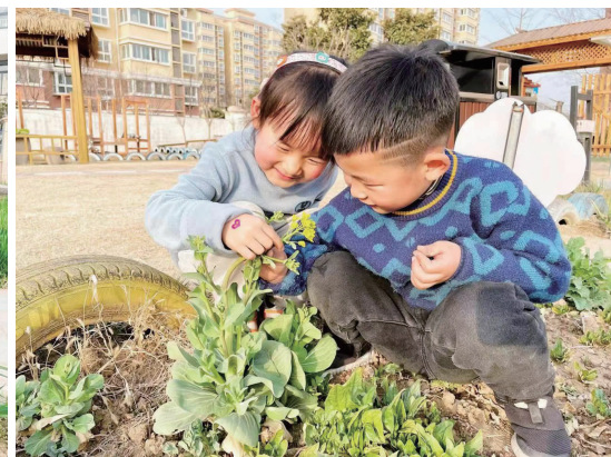
孩子守护、记录植物的成长