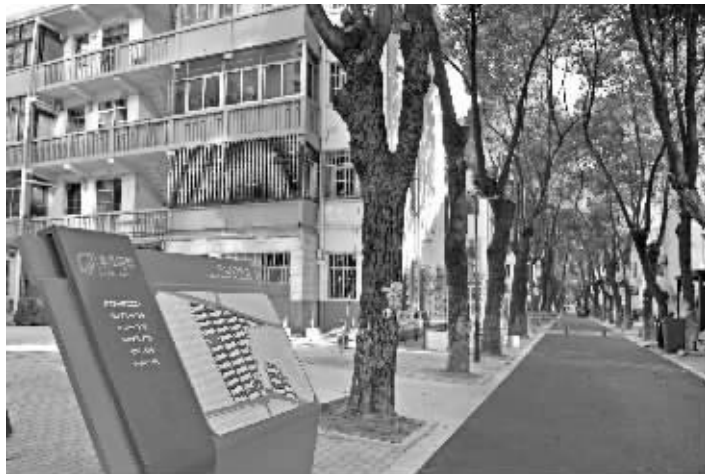
改造后的清凉新村二社区

理“软件”也将同步升级。据悉,改造完成后,清凉新村第二社区将把物联网、大数据等新一代信息技术运用到小区的后续管理中,构建集“智慧党建、智慧社区、智慧养老、智慧安防、智慧物业”等功能为一体的智能化平台,党员、居民信息档案一键查阅、动态管理,空巢老人、残疾人等重要群体实时掌握健康状况,老人在家中通过智能手环一键呼叫专业养老机构上门服务。社区综合服务窗口也将落实“一窗受理、全科服务”,社区服务“只找一个人、能办所有事”。