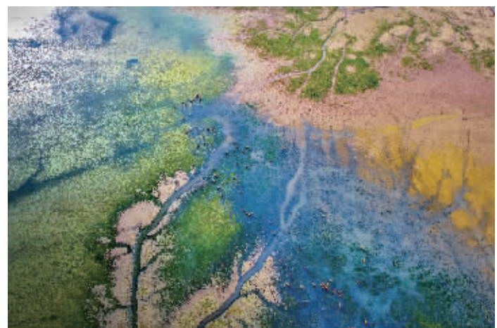
盐城黄海湿地

盐城是一座英雄的城市、光荣的城市，是一片红色热土。新时代，如何续写革命老区荣光？“我们要扛起使命担当，用好红色资源，讲好红色故事，传承红色基因，赓续红色血脉，把革命先辈开创的伟大事业不断推向前进。”盐城市相关