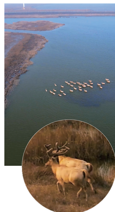
野生麋鹿群现身如东