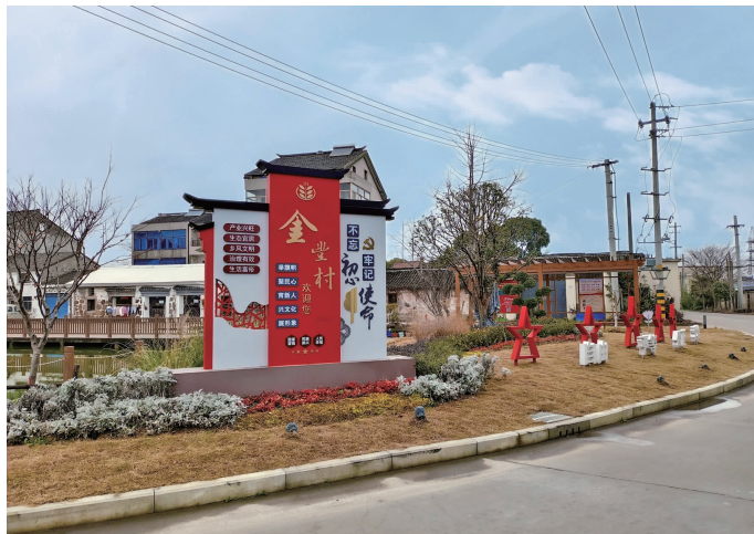
常州经开区横山桥镇金丰村(左为金丰村村民自治章程)