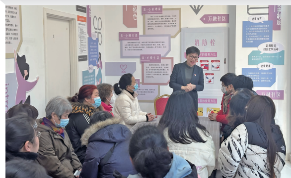
律师进社区开展反家暴普法讲座