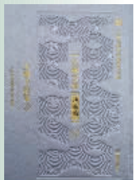
《江苏文库·精华编》 之《金楼子校笺》