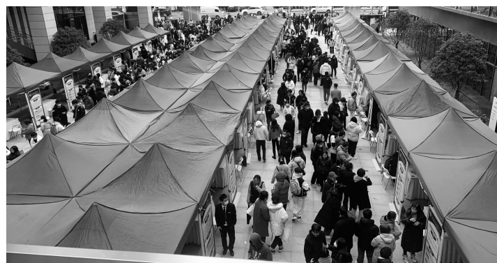
招聘会提供的700多个工种、近13000个就业岗位,吸引了众多求职者

“您公司的薪资待遇如何?”“有双休吗?”“是否交五险一金?”……上午8点30分左右,离招聘会开始还有半小时,已经有不少求职者寻找“先机”,主动咨询、投递简历。有些抢手的企业还需要排队咨询。