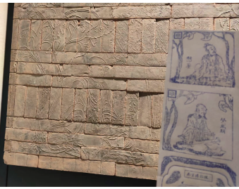
南博砖画人物印章