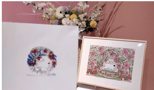
省美术馆三色兔子章