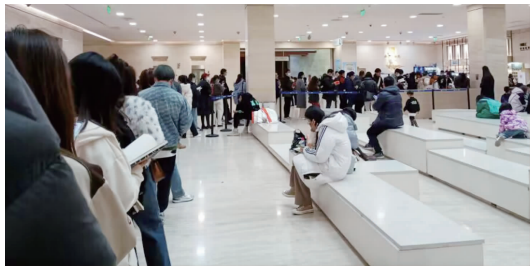
在南博排队等待盖章的参观者