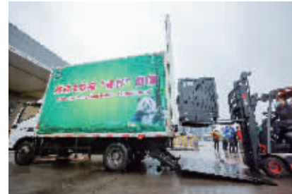
2月21日，“香香”抵达成都双流国际机场，准备搭乘货车前往中国大熊猫保护研究中心雅安碧峰峡基地