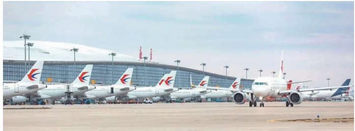
南京机场