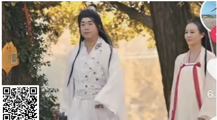
湖北省随州市文旅局局长解伟拍摄的诙谐视频截图