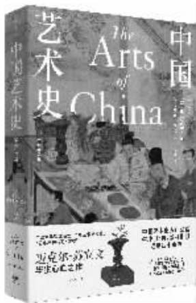
上海人民出版社·世纪文景 2022年8月 《中国艺术史(全新修订版)》 [英]迈克尔·苏立文

牛津大学荣休院士、艺术史家迈克尔·苏立文,因为传播中国艺术与东西方交流方面的杰出贡献,被称为“艺术界的马可·波罗”。