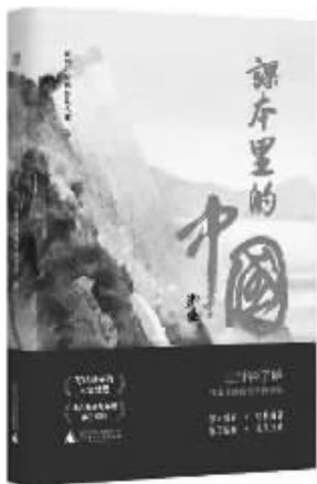
广西师范大学出版社 2022年10月 《课本里的中国》 光明日报摄影美术部编

我们的祖国,地大物博,幅员辽阔,960万平方公里的土地上,生活着世界近1/4的人口,创造了五千年悠久古老的人类文明。