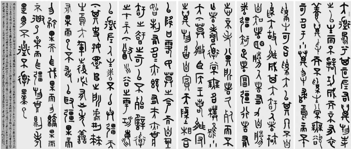
篆书六条屏《老子道德经节选》

李后主有论书句曰:壮岁书亦壮,犹嫖姚十八从军,初拥千骑,凭陵沙漠,而目无劲敌;又如夏云奇峰,畏日烈景,纵横炎炎,不可向迤,其任势也如此。盖谓李重光之论,甚能契合书理之妙处,若是壮年之书,不能风发鹰扬,鱼龙潜跃,终不能得“变化”二字之真谛也。书者,起于方正,行于温润,止于清凉,当是合乎变化之理。近见人作书,食古者多矣,化出者少矣,岂不知书法二字若不能从古人化出,终不是自家面目,到死也是一抄书匠也。或谓:如何是壮年之书?对曰:壮年之书,当求厚,求拙,求雄浑,求空灵。譬如长江大河,譬如阵云千里,譬如海天月色,譬如云蒸霞蔚。试以郭列平先生书法说之,养墨以灵,活笔以神,虚实相生,吐纳纷纭,大云覆宇,中含古春。其更是以厚积之法而涵养虚灵之气,修身之则以见俊逸之态。其笔底壮阔恣肆,纷披浑厚,一往无前,滔滔不竭。余所以谓郭列平先生之书是壮年之书,是称其厚拙。书何以谓之厚拙?必是积累而成也。郭列平之书法,由篆入草,由草入隶,更由隶入行,三者相互融通,使篆有草灵动之意,而不拘泥呆滞;隶有隶高古之气,而不轻浮滑脱;行有行清逸之味,而不僵硬板实,三者相互变通,相互印证,才见其书法精彩之处。遍及诸家,裁成一象,由是厚拙古淡,方是此大手笔也。