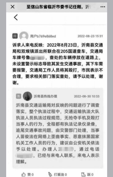
庞某某微信文中沂南县的官方回复